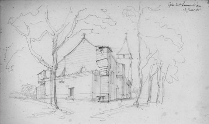
Dessins de Leo Drouyn de l'église de St Laurent d'Arce